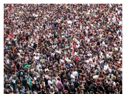
Am 1. Juni 2016 wird bei allen zentralen ARA der Schweiz zum ersten Mal eine Abgabe von 9 CHF pro angeschlossene Einwohnerin und angeschlossenen Einwohner erhoben.

Zu ihrer Unterstützung der Kantone und Gemeinden sind verschiedene Hilfsmittel geplant, die entweder bereits vorliegen oder gegenwärtig in Zusammenarbeit mit den Betroffenen und weiteren Fachleuten erarbeitet werden.