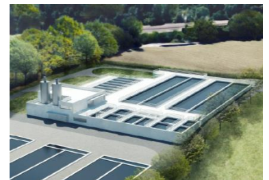
Abb. 2: Ansicht der Anlagenerweiterung im Anschluss an die bestehenden Nachklärbecken.

Die Änderung der Gewässerschutzverordnung (in Kraft seit 1. Januar 2016) sieht vor, dass unter anderem Anlagen mit mehr als 80'000 angeschlossenen Einwohnern eine Stufe zur Elimination von organischen Spurenstoffen installieren. Dies betrifft die ARA Thunersee mit Vorfluter Aare. Gemäss der Planung des Kantons Bern soll die ARA Thunersee bis 2025 ausgebaut werden. Da ab 2020 grössere Sanierungsarbeiten an den Belebungs- und Nachklärbecken anstehen, hat sich der Gemeindeverband für eine rasche Umsetzung entschlossen. Die Delegierten haben dem Kredit von knapp 26 Mio. Franken am 29. Oktober 2014 zugestimmt. Rund 75% der Erstinvestitionen wird der für diese Ausbauten eingerichtete Bundesfonds übernehmen. Vom Kanton sind ebenfalls Fondsbeiträge im Umfang von gut 2 Mio. Franken zu erwarten. Zur Erstellung der neuen Reinigungsstufe steht das Reserveland südlich der heutigen Anlage zur Verfügung.