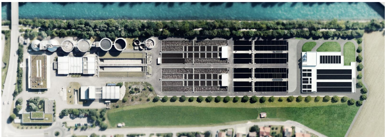
Abb. 3: Luftansicht der bestehenden und neuen Anlageteile